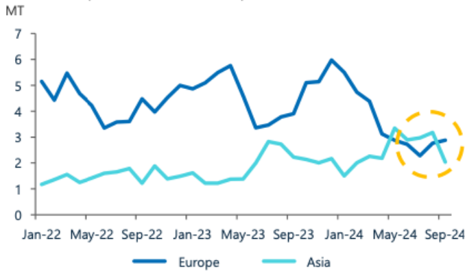
U.S. LNG Exports to Asia vs. Europe (FOB)